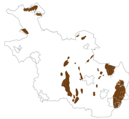
Overzicht stuwwallen (indicatief)