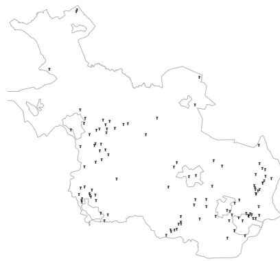
Overzicht landgoederen en buitenplaatsen (indicatief)