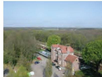
Foto's: • De 'groene loper' bij station Oldenzaal • Halte in het landschap - station Mariënborg vanaf de voedersilo

functie: persoons- en goederenvervoer tracering: eigenstandig karakter: stations als overstappunten