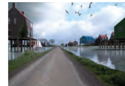
Voorbeeld: Project Kampen Weir, bron: MVRDV 2005