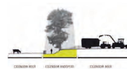
Schema: functioneel grootschalige landbouw in een ruimtelijk kleinschalig landschap